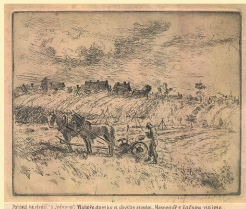
Polní trať „Véhonu“. Vlevo domky a sýpky, vpravo stodoly. Hospodář s žačkou vije žito.

vali jsme tam rané brambory nebo jetel nebo něco, co bylo třeba na trakaři dovézt „na rychlo“, když se doma nedostávalo. Na horním konci pole bylo za stodolami, kolem obecní sýpky, několik chaloupek. Tam chovali husy, slepice aj. domácí zvířata (kozy apod.), ty si dlouho nevybíraly a pásly se až daleko do pole. A tak jsme tomu políčku říkali, že je „na škodě“. Hutař, tj. hlídač polí, který tam přistihl husy, tak je „zajal“ a po nějakém tom křiku a hádce je zase pustil. Někdy se stalo, že tu husí chásku zahnal ke starostovi a tam si je musela majitelka „vykoupit“. Kopeček „Stráž“ býval naším oblíbeným místem klukovských her. Jak napadl sníh, sáňkovali jsme na sáňkách vesměs vlastní výroby, v létě jsme se tu honili a hráli na vojáky. Vypukl-li někde v okolí požár, prvně jsme utíkali se podívat ze strážce, kde to hoří.