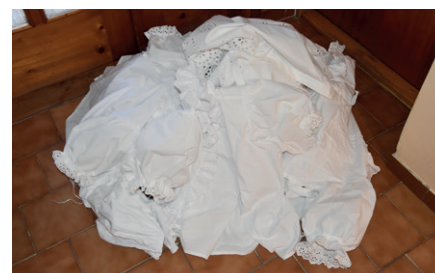
Pondělní ráno – vše může začít od začátku