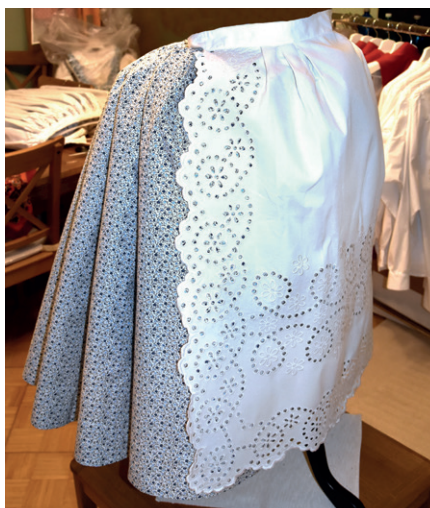
Kontrola zástěrky a sukně