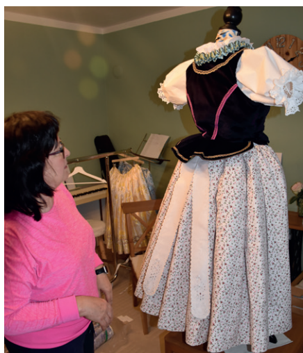
Kontrola dílčích částí na figuríně