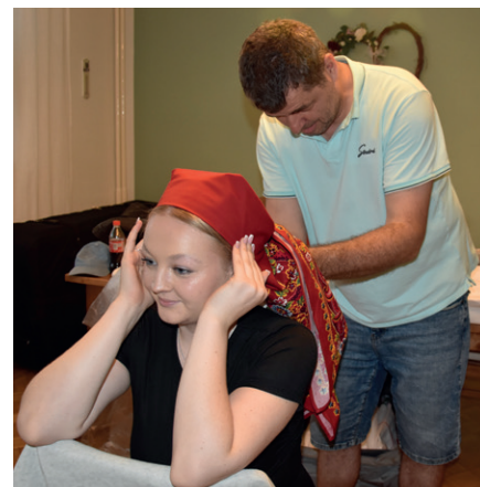
Vázání šátku každé stárce