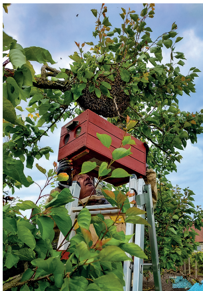
Přítel Václav ve svém království včel

jejich svatební ševlení. Energie z roje přímo sálá... Další je pak již otázkou Václava umu a grífu. Podstrčit pod roj přenosný roják, klepnout a urychleně roják uzavřít trvá pár sekund. Bzučící, téměř hučící bednu plnou létajícího medu a žihadel staví Václav na připravené schůdky pod větví, na které roj visel. Včelky, které se nepodařilo sklepnout, teď kolem něj krouží a bzučivě brblají. Ony už je královny feromony spolehlivě nasměrují během pár hodin do společnosti ostatních včeliček.