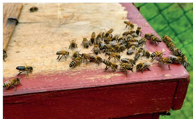
Vířením křídel podél vztyčených zadečků navigují včelky zbytek roje ke vstupu do rojáku