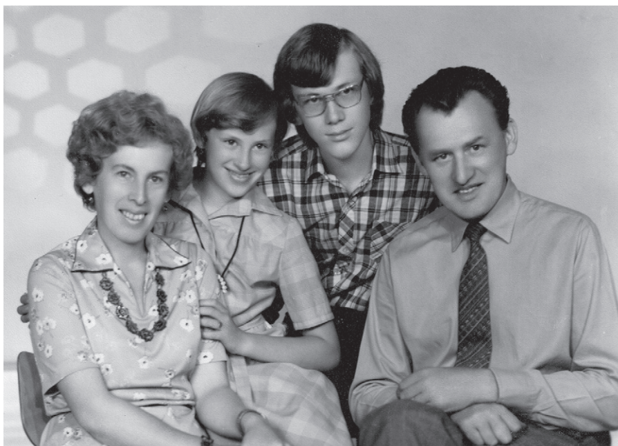
Rodinná fotografie, asi z roku 1980

To nebylo nic jednoduchého. Manžel v Plzni pracoval ve Škodovce a dostal nabídku pracovat v Indii a vzít s sebou i rodinu. V té době, konkrétně v roce 1966, se nám už narodil syn. Vycestování do Indie nám přišlo jako skvělá příležitost, tak jsme souhlasili. Manžel tam jel asi o tři měsíce dříve, aby se zjistilo, zda bude schopen v tamních podmínkách pracovat. A já s ročním synem letěla později. Přílet na letiště v Bombaji byl neskutečný šok. Klima bylo jako ve skleníku, tj. dusno a vedro, a doslova všude byly mraky lidí a mezi nimi i na první pohled nemocní. Kdybych tehdy mohla, tak bych se na místě oto-